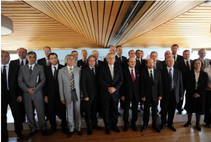
2009 En İyi Örnek Uygulama Seçilen Sektörel Yayılımın İlki: İlaç Sektörü