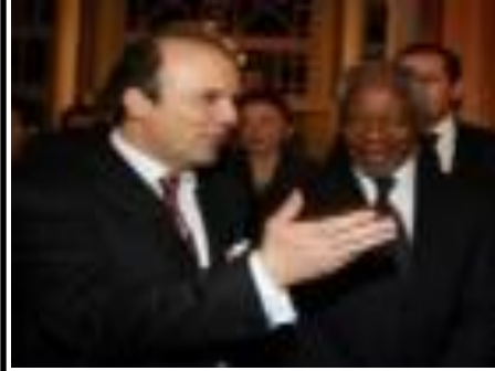
2006 Liderler Gala Yemeği & Koç Holding'in UN Global Compact imzası