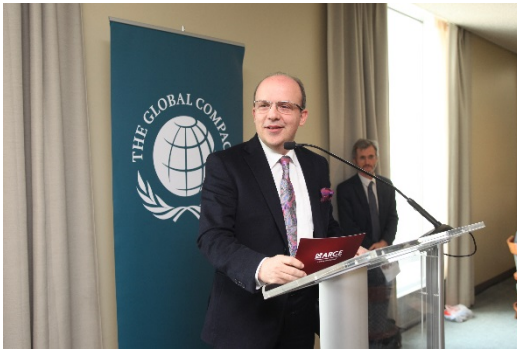
2015 BM Sürdürülebilir Kalkınma Hedefleri Büyükelçiler Yemeği