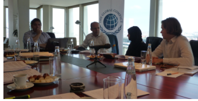
2013 İlk Ulusal Ağlar Danışma Kurulu (LNAG) Toplantısı İstanbul'da