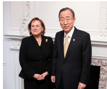
2012 Güler Sabancı UN Global Compact Yönetim Kurulu'na Atandı