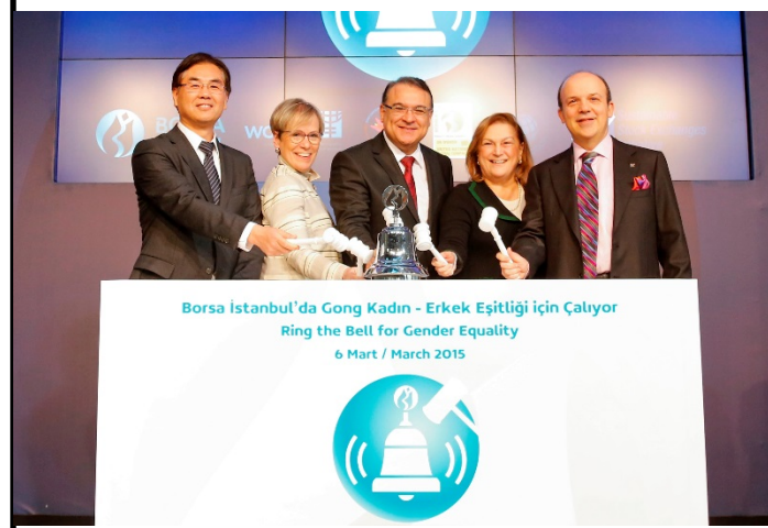
2015 Kadının Güçlenmesi Prensipieri