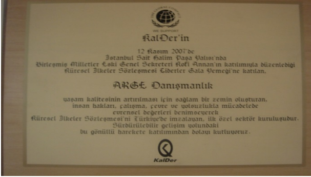
2002 ARGE Danışmanlık ilk Türk İmzacı