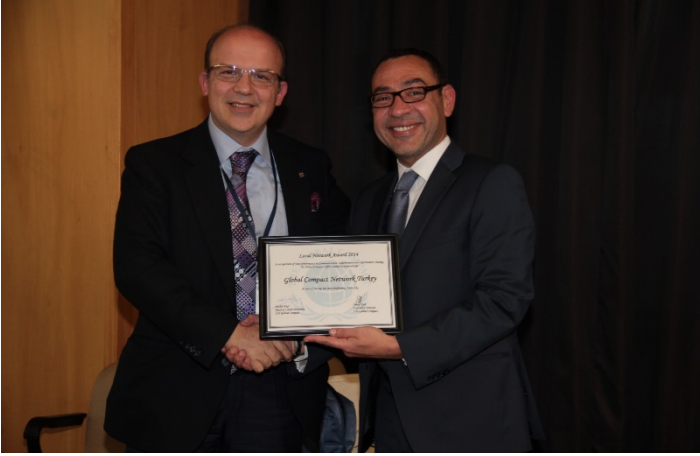
2014 Global Compact Türkiye'ye En Başarılı Ulusal Ağ Ödülü