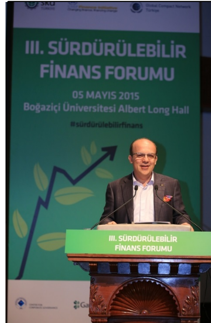
2015 Sürdürülebilir Finans Forumu (Çarpan Etkili İşbirlikleri)