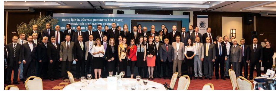
2014 Barış İçin İş Dünyası (B4P) Platform Akdeniz Bölgesi Tanıtımı Mersin'de