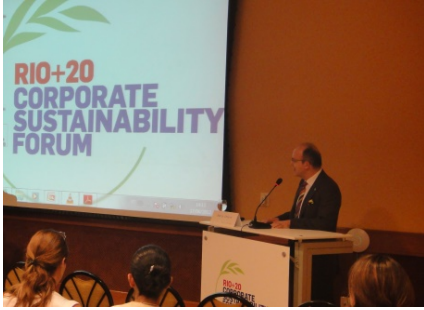
2012 Rio + 20 Kurumsal Sürdürülebilirlik Forumu